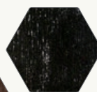
14. ÉBÈNE (série W/T)