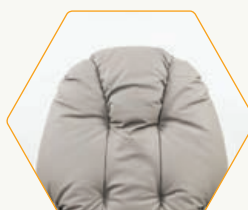
DOSSIER CONFORT +