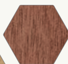
12. ACAJOU (série W/T)