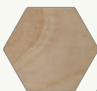
10. MERISIER (série R/W/T)

Quatre teintes de bois et trois styles de dossier permettent de personnaliser le Thera-Glide® de bois selon vos goûts